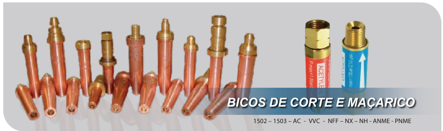
BICOS DE CORTE E MAÇARICO

1502 - 1503 - AC - VVC - NFF - NX - NH - ANME - PNME